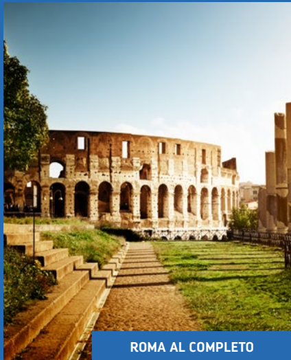
ROMA AL COMPLETO

Las siguientes excursiones se pueden realizar al embarcar en el Oasis of the Seas desde Barcelona