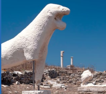
NAVEGA A LA ANTIGUA ISLA DE DELOS

DURACIÓN 4:45 HORAS | PUERTO DE SALIDA: KUSADASI