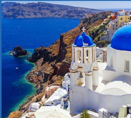
SANTORINI Y EL PUEBLO DE OIA

Las siguientes excursiones se pueden realizar al embarcar en el Explorer of the Seas desde Rávena.