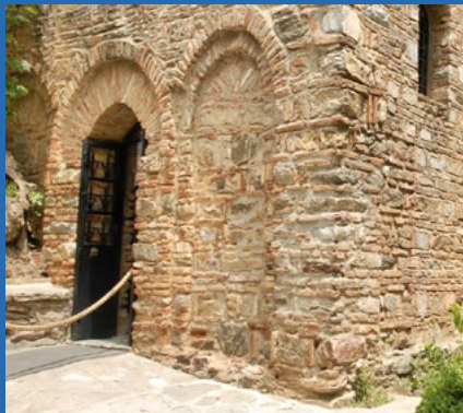
ÉFESO Y LA CASA DE LA VIRGEN MARÍA

Las siguientes excursiones se pueden realizar al embarcar en el Odyssey of the Seas desde Roma.