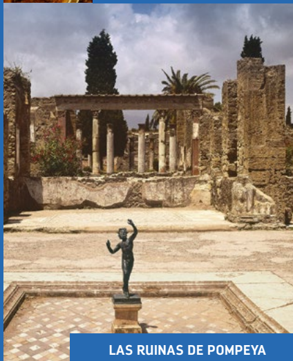
LAS RUINAS DE POMPEYA

DURACIÓN 9.30 HORAS | PUERTO DE SALIDA: CIVITAVECCHIA