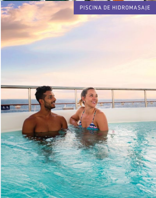
PISCINA DE HIDROMASAJE

PARADAS Kotor, Montenegro; Mykonos, Grecia; Santorini, Grecia; Split, Croacia; Dubrovnik, Croacia; Corfu, Grecia; Atenas (el Pireo), Grecia; Sicilia (Messina), Italia