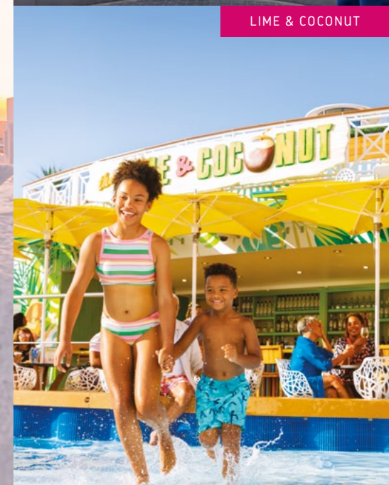
LIME & COCONUT