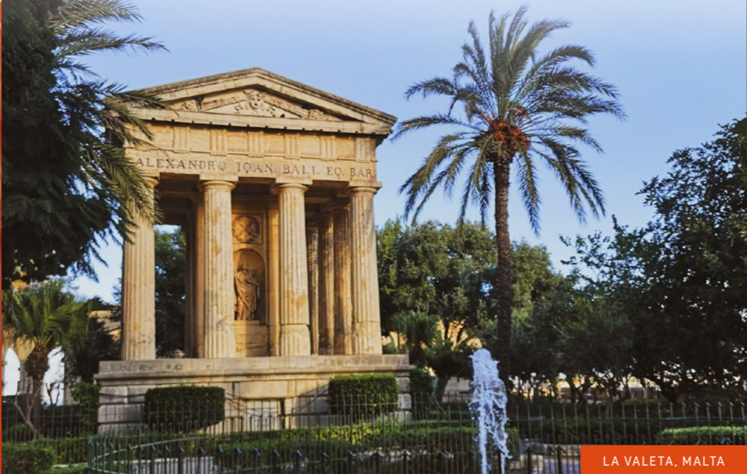
LA VALETA, MALTA