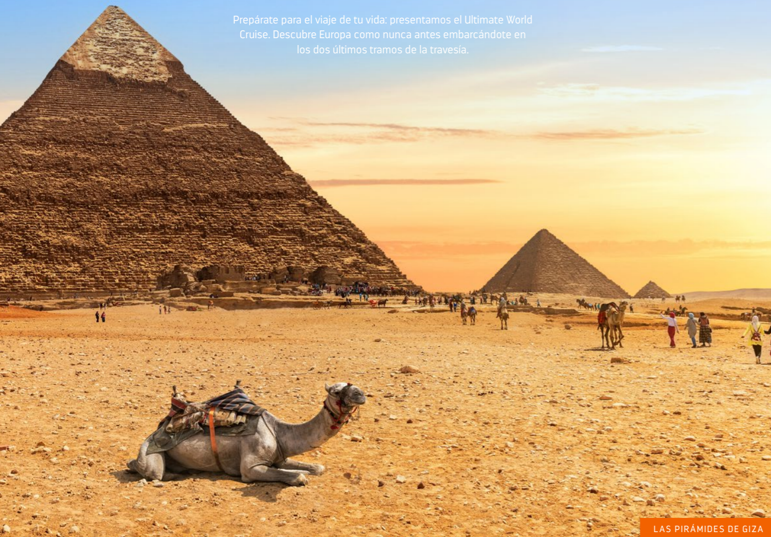
LAS PIRÁMIDES DE GIZA

Prepárate para el viaje de tu vida: presentamos el Ultimate World Cruise. Descubre Europa como nunca antes embarcándote en los dos últimos tramos de la travesía.